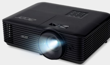
Projecteur 4,500 Lumens SVGA X1128HK