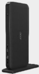
Acer USB Type-C Dock III