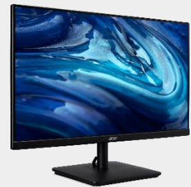
Moniteur 24" ZeroFrame FHD VA2 series